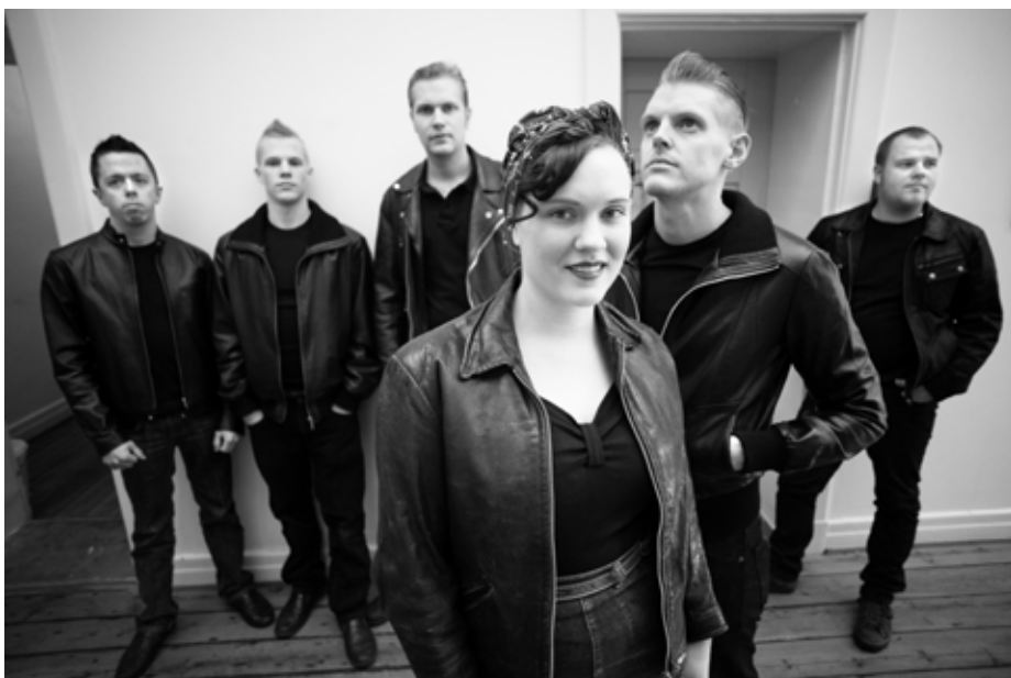
Den 4 maj har vi rockabillykväll, med Fancy Dan på scenen och 60-talsbuffé. Kom gärna i tidsenliga kläder så har du möjlighet att vinna ett fint pris.